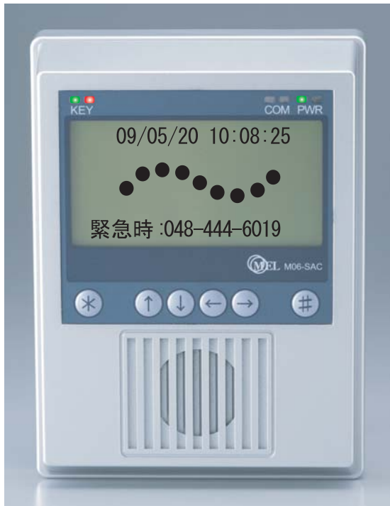
※画面表示およびLEDはイメージです