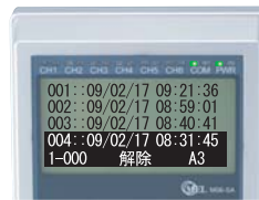
ジャーナル表示画面例

操作されたカードリーダー毎に警備開始/解除の情報や、操作者のカード番号、時刻、通信状況などをジャーナルとして記録します。内容をカードリーダーで確認できる他、PC側にアップロードして記録保存することもできます。(約5,000データまで保存可能)