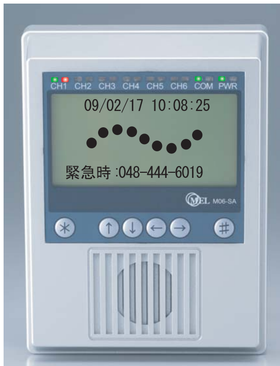
※画面表示およびLEDはイメージです