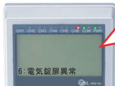
異常検知中センサー名称表示画面

警備開始操作時にセンサー異常検知中の場合、どこの異常かを画面で見ることができるようになりました。